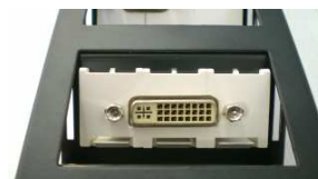
DVI- Buchse 24+5